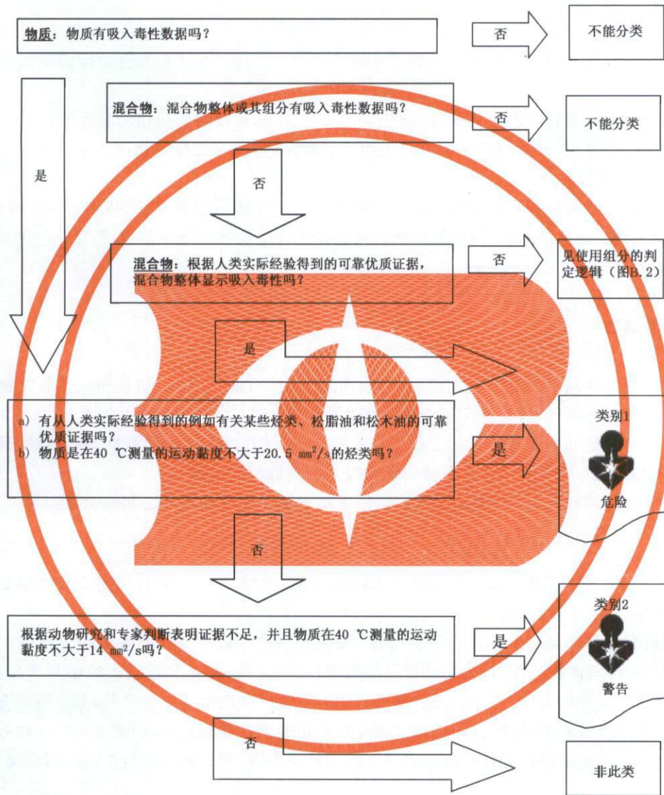
图 B.1 吸入危害判定逻辑