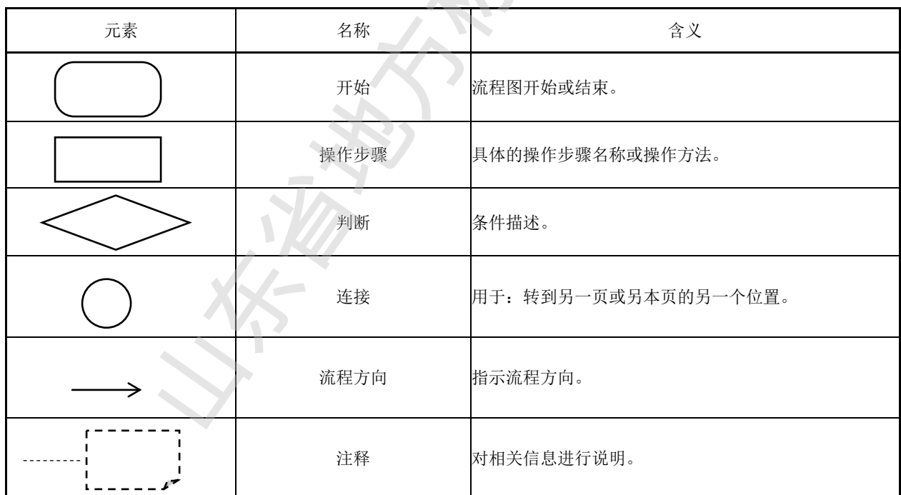
表B.1 流程图常用符号及含义

说明：资料性附录属于参照执行内容，企业可以在满足导则正文要求的基础上自行设计模板。